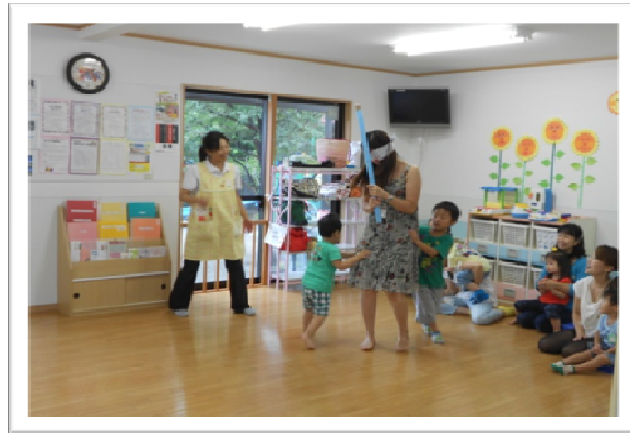
みんなですいか割り！