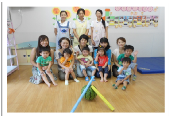
大きなすいかの前でハイポーズ！

活動内容：“元気いっぱいすいか割り！” すいか割りに挑戦し、おいしくすいかを食べました。