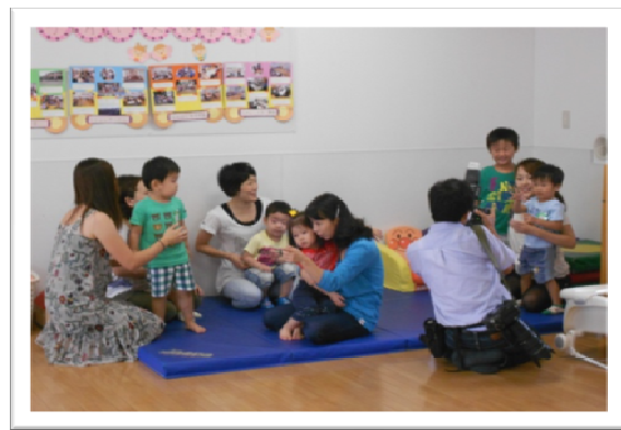
みんなですいかをいただきました