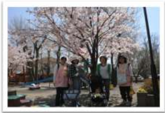
満開の桜の木の下で ハイ！ポーズ！！ お散歩楽しかったね！