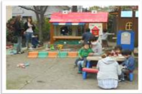
好きな遊びを見つけて、 思い思いに楽しんでいます。