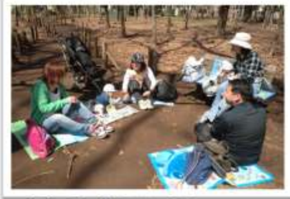
青空の下で春探しをしました。 その後は、みんなでおやつを食べて楽しい時間を過ごしました。

4月12日(木)第1回保育体験・子育て講座を開催しました。 活動内容: "自然で遊ぼう"(親子で参加) 近くの公園へお散歩に行きました。