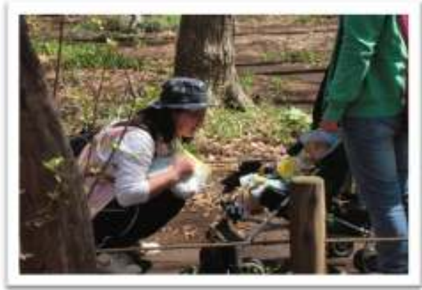
どんな春を見つけたかな...♪ ぽかぽかイイお天気で気持ちいいね♪