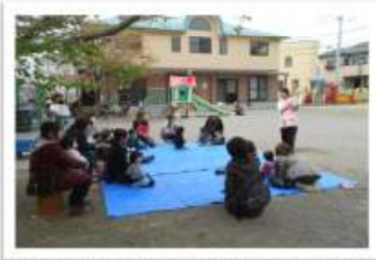
遊ぼう会では、読み聞かせを行っています。 今日はどんな絵本かな...♪