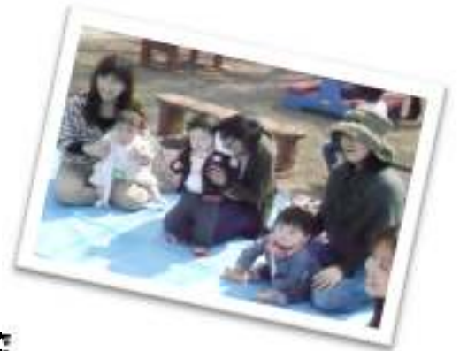
暖かい日が増え、おひさまの下で 輪投げをエイっ！！