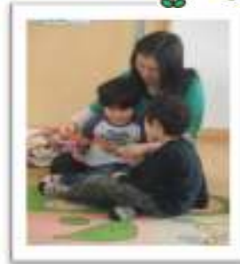
出し物:「切り紙」 半分に折った画用紙 をチョキチョキと 切って開くと…色ん な形に変身!! プレゼントされると 嬉しそうに眺めてい ました。