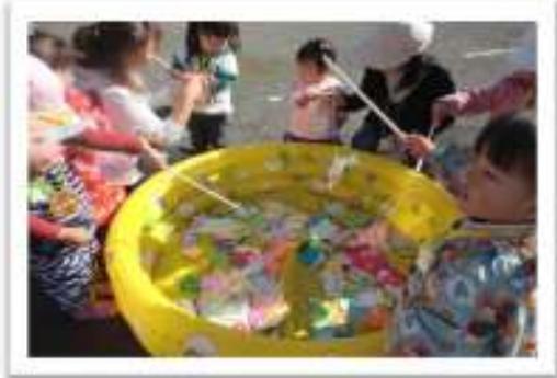
お魚釣りをしたい…

首につけたメダルには、 ひとつ行うごとに シールを貼ってもらい ました☆☆ 青空の下で色々なレクを 親子で楽しみ、とても 楽しい時間となりました。