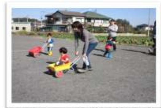
一輪車に乗って、ママに押ししてもらったり…