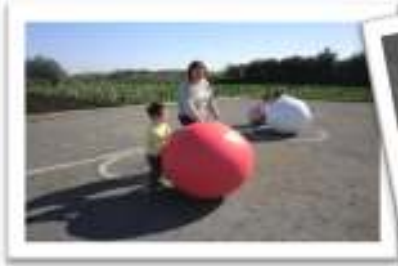
大玉を転がしたり…