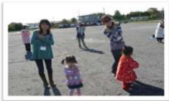
みんなで「どうぶつ体操1・2・3」を行いました。

11月8日(木)第8回なかよしサークル・保育体験・子育て講座を開催しました。 活動内容:「大きなおもも掘れるかな?」 親子でレクリエーションとお芋掘りを楽しみました。