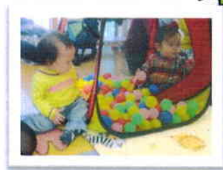
ボールいっぱい嬉しいな♪

2月13日(木) なかよし保育体験・子育て講座を開催しました。 活動内容:「ベビーマッサージ」 親子の触れ合いを楽しみました。