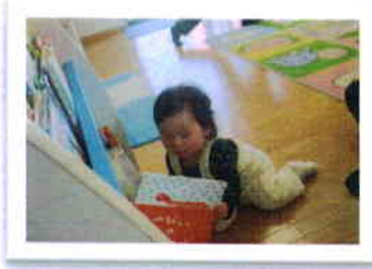
お気に入りの絵本み～っけ♪