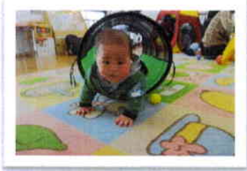
トンネルくぐりできた～☆