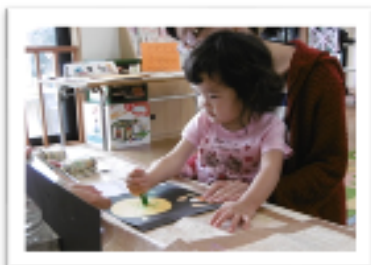
「お月様には何があるかな?」 自由画を行いました。

みんなが大好きな絵本☆ 今日は「だいすきぎゅっぎゅっ」 というお話でした。見終わった後に お母さんにぎゅ〜っとしてもらって 嬉しかったね♪