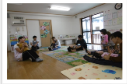
触れ合い遊び:「でんしゃ」 お母さんのお膝が電車・車・飛行機 に大変身!!みんなで冒険の旅に 出掛けました☆