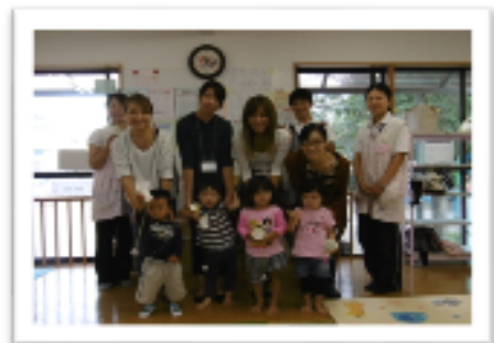
集合写真!ハイチーズ!! お友達といっぱい遊んだね☆