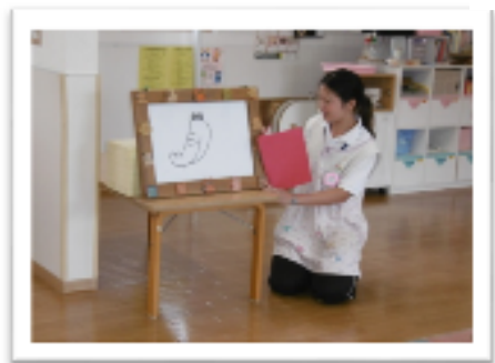
今月の出し物は「えかきうた」 でした♪先生がうたに合わせてペンを 動かすと、あらあら不思議!! 素敵な絵になりました☆