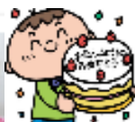
サークルでは大事な大事な お誕生日のお祝いを 毎月みんなでします☆