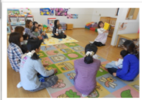
絵本: 「ぼけぼけぼけぼけぼけたくん」 くいしんぼうなおぼけの子のお話を みんな興味津々で見てくださいました♪