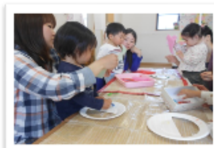
おはながみをくしゃくしゃびりびり〜♪