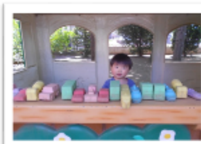
26年度のサークルのスタートです☆ みんなでたくさん遊ぼうね♪