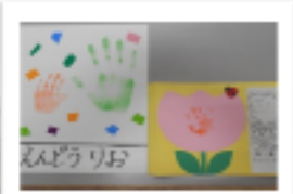
初めてのサークルに遊びに来た記念に 手形を取りました☆