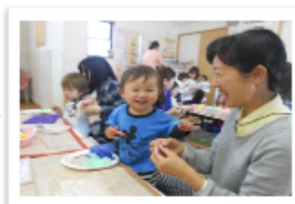
紙皿にぺたぺた 貼り付けて〜♪