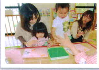
指スタンプはお花の模様に、 手形は可愛いヒヨコになりました!