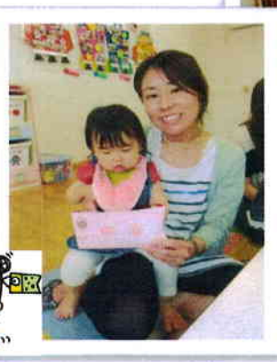
みんなの足型がこいのぼりの うろこになりました。 裏にはシールをペタペタ♪ 顔はクレヨンで描きました。