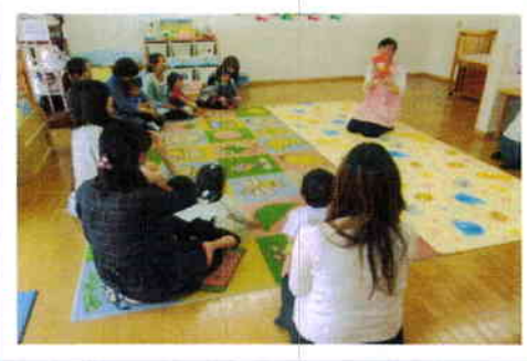
福平・「ゆんじママでゆんじになっに」 みんなとても集中して見てくれました♪