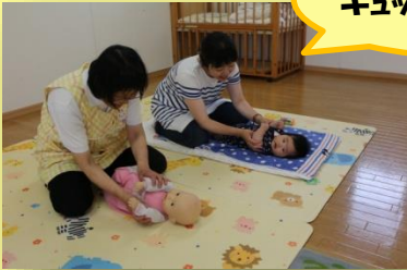
ギュッとしてパッ