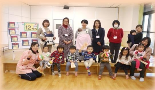
エフロンシアター 「3匹のヤギと からがらどん」

エフロンの中から次々 出てくる子ヤギたち。 子どもたちはお話 にどんどん引き込まれて