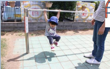
「みてみて〜!すごいでしょ〜!」