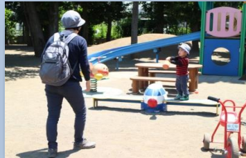
バッティングの 猛特訓!!