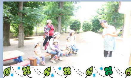
いい天気だったので、外で絵本を読みました!