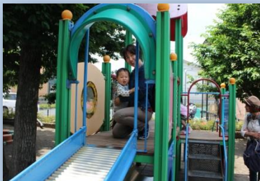
初めてつり橋に挑戦。 ゆっくり渡ってみようね☆