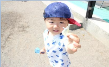
「ちょうちょ、捕まえたよ〜!」