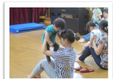
お母さんの膝の上に立てるかな?