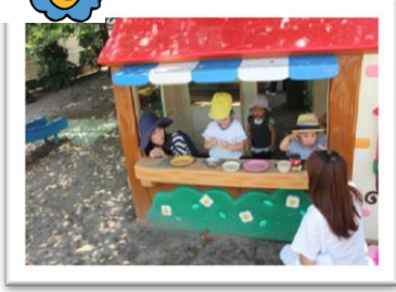
みんなでレストランごっこ♪