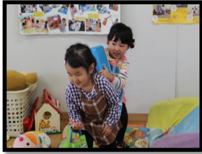
お母さんは大忙し！！

ごっこ遊び ～その2～ おかあさん ごっこ。 エフロンが よく似合って いるね♪