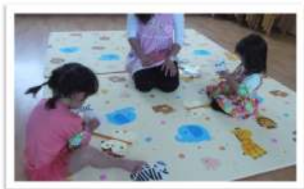
制作:ちょうちょうに模様を付けました。