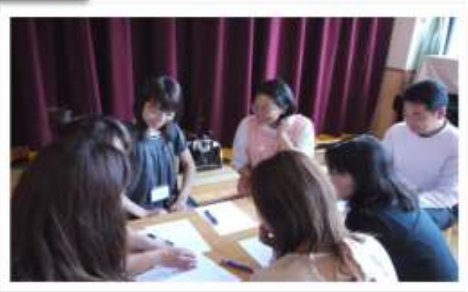
2. 3人に分かれて「今一番頑張っていること」を発表しました。 その後、相手の頑張っているところ、素晴らしいところを伝え合いました。