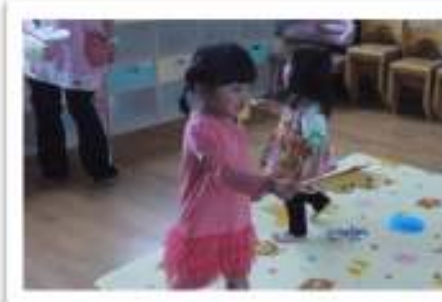
ちょうちょうの歌に合わせて上下に動かし、 羽をひらひら…。 みんなのちょうちょうがお部屋に舞いました。