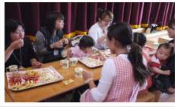
最後はみんなでお菓子を囲んでたのしくお話をしました。